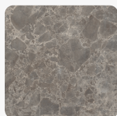
Мрамор Сиена сив F095 ST87 Повърхностна структура Matex керамика