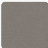
Лен антрацит F433 ST10 Повърхностна структура Deerskin Rough