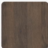
Дъб Гладстон тютюнев H3325 ST28 Повърхностна структура Feel Wood Nature