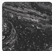
Cosmos Prima PX

повече информация http://www.jaf-bulgaria.com/shop/ploskosti/mineralni-ploskosti-corianr/mineralni-ploskosti/mineralna-ploskost-corianr-cosmos-prima-px-p17230119