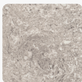
Травертин Кале F052 ST75 Повърхностна структура Mineral Satin