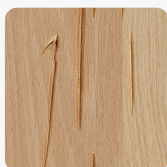
Rogme 605 Повърхностна структура Фурнир