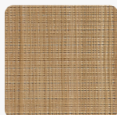
Taglio Sega 906 Повърхностна структура Фурнир