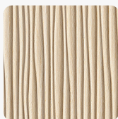
Wave Kima 905 Повърхностна структура Фурнир